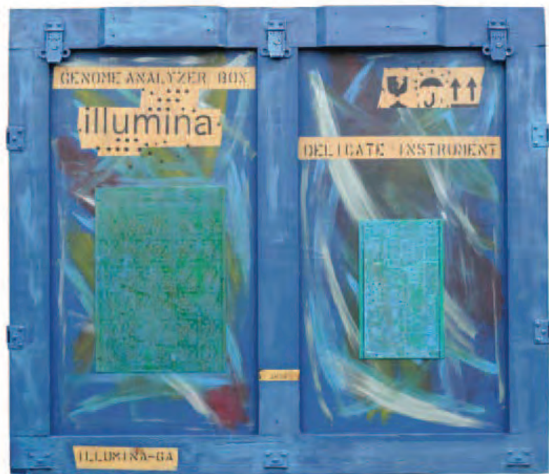
Illumina blu di Zobeide, 2008 Tecnica mista su legno - 103,5 x 118,5 cm