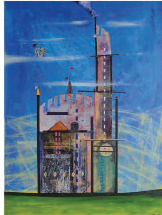
Città invisibili - Armilla Celeste, 2009 Tecnica mista su MDF - 120 x 90 cm