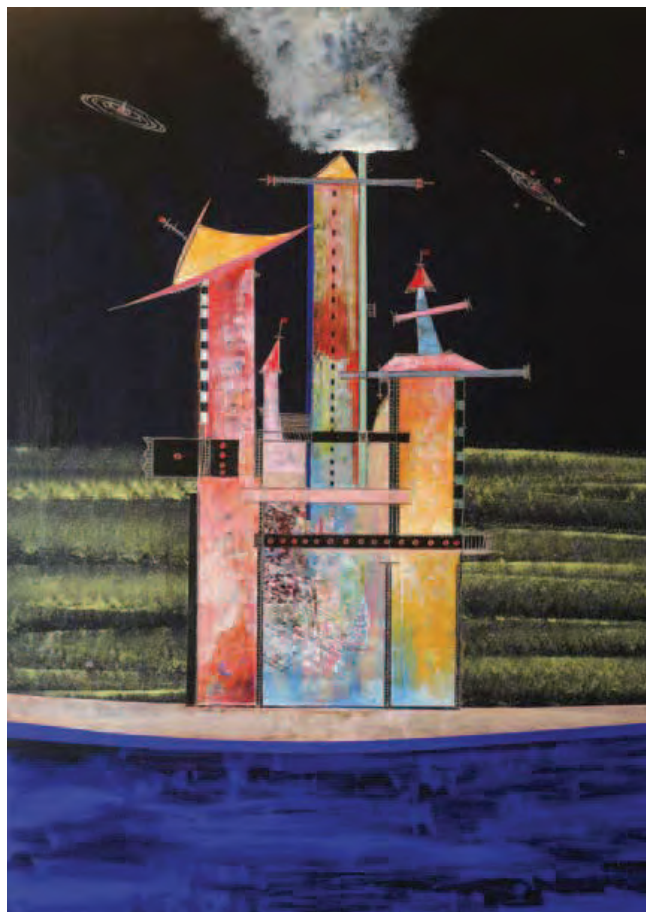
Città invisibili cosmogoniche Adelma, 2008 Tecnica mista su MDF - 120 x 90 cm