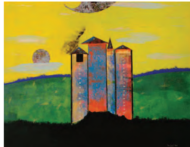
Città invisibili - Castello, 2009 Tecnica mista su MDF - 120 x 90 cm

La mostra raccoglie una ventina di opere appartenenti a due cicli pittorici - Illumina e Città invisibili - che il percorso espositivo, in entrambi i piani del palazzo, pone in costante relazione, a sottolinearne il dialogo capace di mettere in scena la stessa idea di 'città'. Da un lato radicata nella concretezza del fare, dall'altro librata nell'invenzione di spazi pittorici condotti per via di emozionalità cromatica.