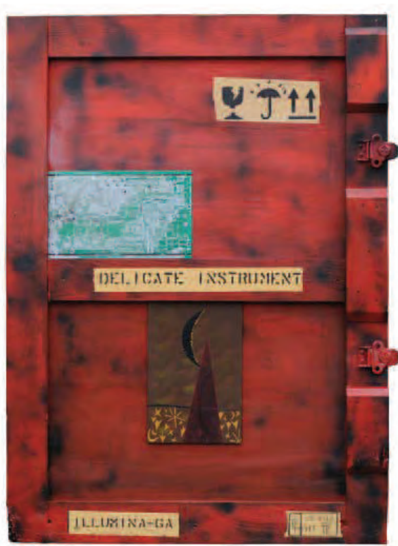
Illumina - rosso Smeraldina, 2008 Tecnica mista su legno - 112,5 x 81 cm