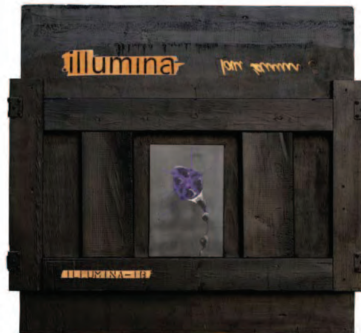
Illumina nero Tecla, 2008 Tecnica mista su legno - 88,5 x 95 cm