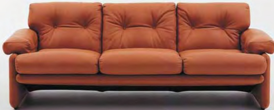
Divano Coronado del 1966 per B&B