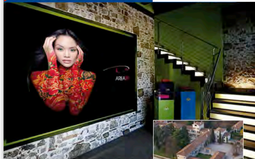
Foto emblematiche e rappresentative